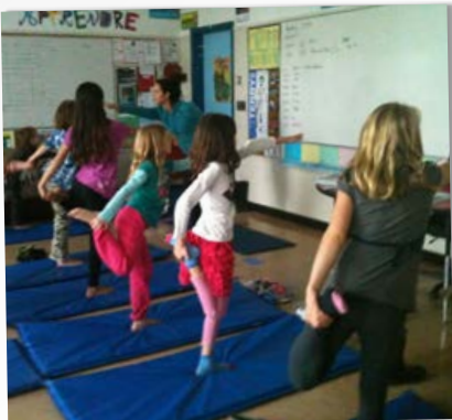
L'HEURE DU YOGA :-)

Cette initiative adhère à la philosophie de l'école communautaire citoyenne et au nouvel objectif proposé au comité des partenaires: «Le français sort des murs! Libre de parler français où je veux!»