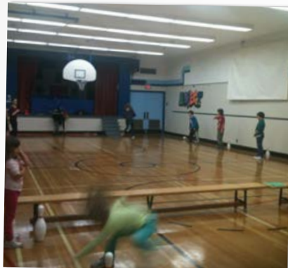
JEUX DE QUILLES POUR TOUS!